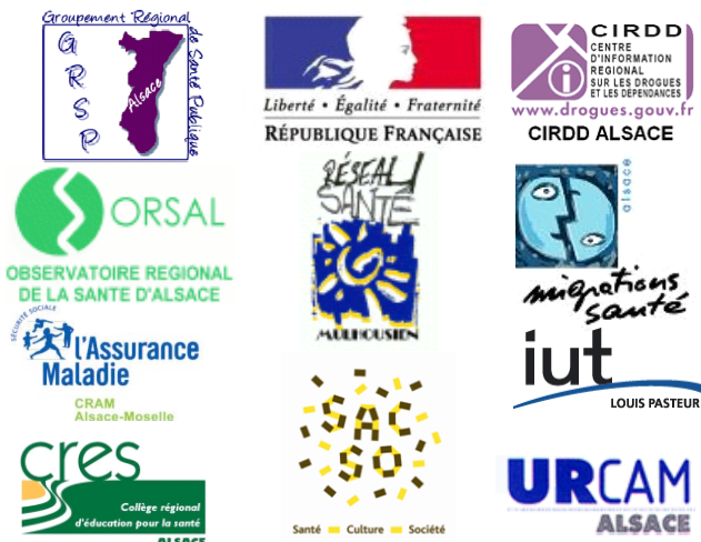
Plate-forme ressources en éducation pour la santé :